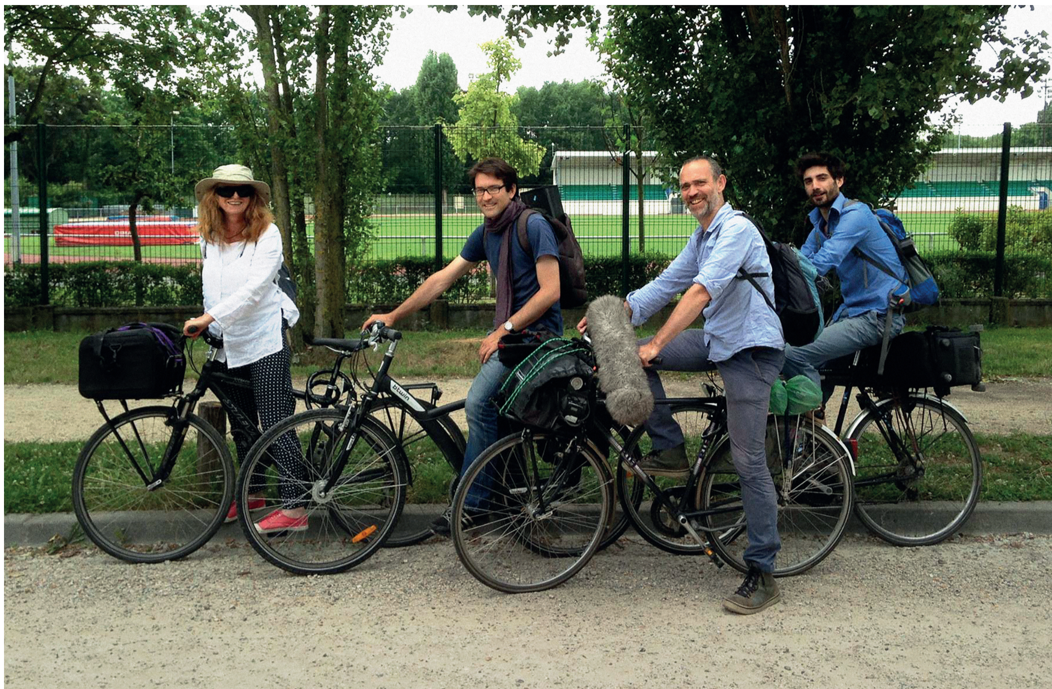
DOCUMENT NON CONTRACTUEL

C LAIRE SIMON EST NÉE EN GRANDE-BRETAGNE, et passe la majeure partie de son enfance dans le Var. Étudiante en ethnologie, arabe et berbère, elle décroche des stages de montage grâce à la Cinémathèque d'Alger. Refusant d'intégrer une école de cinéma, elle tourne ses premiers courts métrages en autodidacte au milieu des années 70. Son passage aux Ateliers Varan se révèle décisif : elle y découvre les vertus du cinéma direct et décide de s'orienter vers le documentaire. Parallèlement à son travail de monteuse, elle réalise plusieurs courts métrages, dont LA POLICE, primé au Festival de Belfort. En 1991, Claire Simon signe pour le petit écran une série remarquée, SCÈNES DE MÉNAGE, dans laquelle elle prend un malin plaisir à brouiller les frontières entre documentaire et fiction : dans chacun de ces dix films, une femme au foyer (Miou-Miou) accomplit une tâche domestique en pensant tout haut à sa vie conjugale. Un an plus tard, avec RÉCRÉATIONS, elle observe la cruauté à l'œuvre dans les cours d'école, mais le film ne sortira en salles qu'en 1998. Entre-temps, la cinéaste s'est fait un nom dans le monde